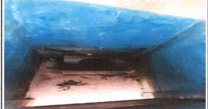
Foto 4: Se cambiará las tres letrinas de concreto quebradas con letrinas de plástico