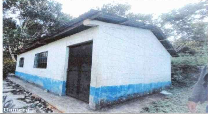
Foto 1: Las láminas y costaneras del Aula de Preprimaria serán sustituidas con láminas troqueladas