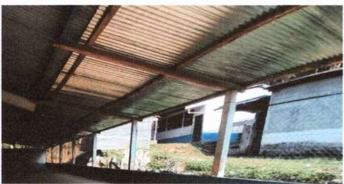
Foto 3: El corredor de las tres aulas se cambiará las tijeras de madera con costaneras y láminas troqueladas.