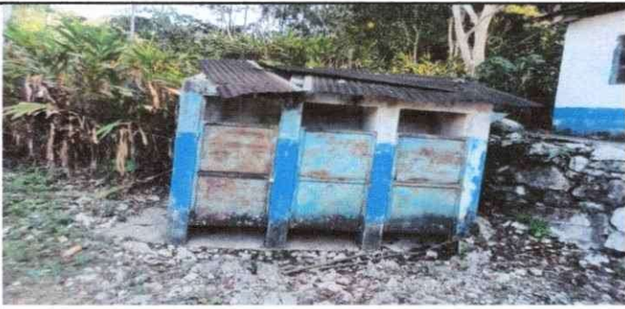
Foto 5: Cambio de techo de los 6 módulos de letrinas con láminas troqueladas.